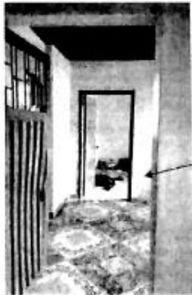
IMAGEN 3. En la imagen se logra observar la puerta de entrada al cuarto piso del inmueble objeto de la diligencia.

PUERTA DE INGRESO AL CUARTO PISO DEL INMUEBLE OBJETO DE LA DILIGENCIA