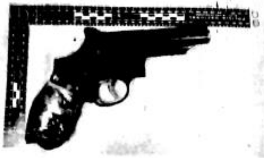
IMAGEN 9. En la imagen se logra observar un arma de fuego tipo revolver color negro de marca Martial 385

Este informe será remitido por la Policía Judicial para aquellos casos donde el arma no sea objeto de informe ejecutivo