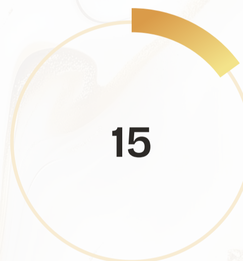
Sectores económicos atendidos