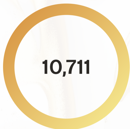
Tiendas en línea creadas

Tu Negocio en Línea ha operado desde 2023 y ha impactado a miles de emprendedores en todo el país. Estas son las cifras acumuladas hasta 2025: